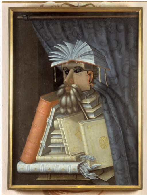
Giuseppe Arcimboldo Il Bibliotecario , 1566